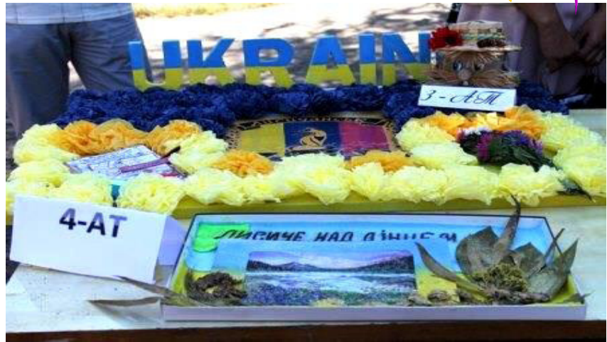
Композиція з конкурсу поробок на «Коледжному Арбаті»

Традиційні свята - «Посвята першокурсників» та «Шанс.Коледж. UA» - стали найулюбленішими осінніми заходами серед студентів. Кожного року першокурсники вражають нас оригінальністю та яскравістю концертних номерів, але у цьому році ми остаточно переконалися: тільки в нашому коледжі – найспівучіші голоси, найбадьоріші танцюристи та найвіртуозніші виконавці музики! Невдовзі «Свято першокурсників» відбулося і в гуртожитку. Тож цього року «скарбниця талантів» коледжу поповнилася новачками.