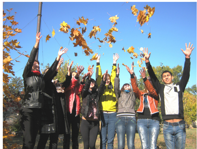
Випускники коледжу зі студентами

Вихователь! — Яка висока потрібна тут душа!.. Воістину, щоб створити людину, треба самому бути або батьком, або більше, ніж людиною. Ж.-Ж. Руссо