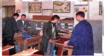
У навчальних майстернях