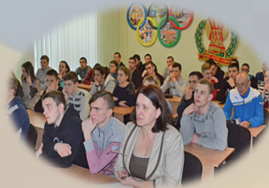
Фаховий кабінет-лабораторія фізичного виховання