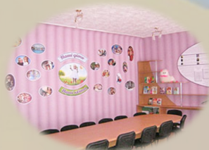
Лабораторія фахової компетентності педагога дошкільної освіти