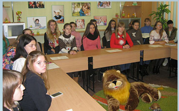
Студенти освоюють SMART-технології з метою якісного проходження практики