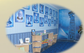
Лабораторія історії освіти і педагогіки

Створення освітнього музейно-педагогічного комплексу, мережі фахових наукових лабораторій є одним з найактуальніших сфер коледжу в XXI столітті. Освіта молоді в таких умовах є науково обґрунтованою, такою, що продукує нові знання, забезпечує індивідуальний розвиток людини. І тільки той навчальний заклад, який спроможеться забезпечити пріоритетний розвиток цих сфер, зможе підготувати фахівця, здатного претендувати на гідне місце в світовому співтоваристві. Саме такі пріоритети ставить перед собою колектив Лисичанського педагогічного коледжу на шляху до інноваційних перетворень!