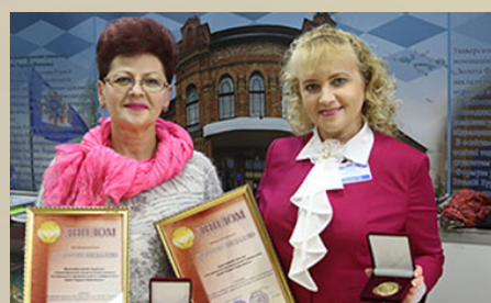
Золота медаль Міжнародної конкурсу-виставки «Сучасні заклади освіти» (2010, 2016, 2017 роки)