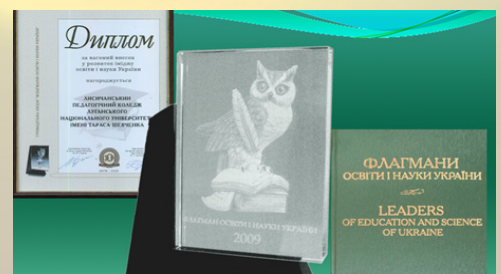
Педагогічний коледж – Флагман освіти України (2009, 2011 роки)

Саме завдяки наполегливій праці освітян коледжу навчальний заклад двічі поспіль визнаний Флагманом освіти України і вже тричі став переможцем Міжнародної конкурсу-виставки «Сучасні заклади освіти».