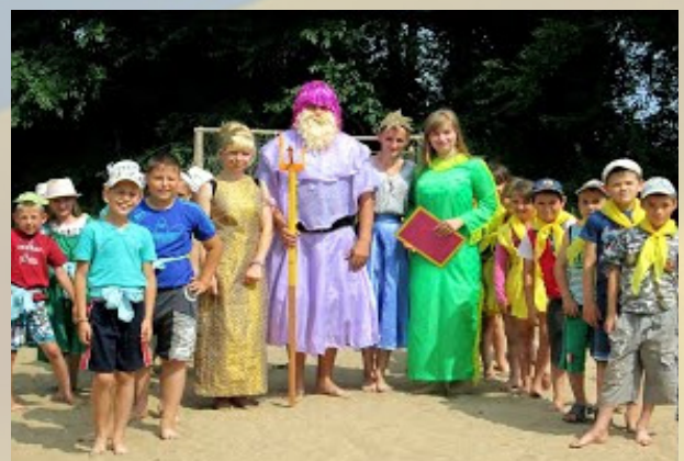
Практика в літніх оздоровчих таборах: цікаві моменти