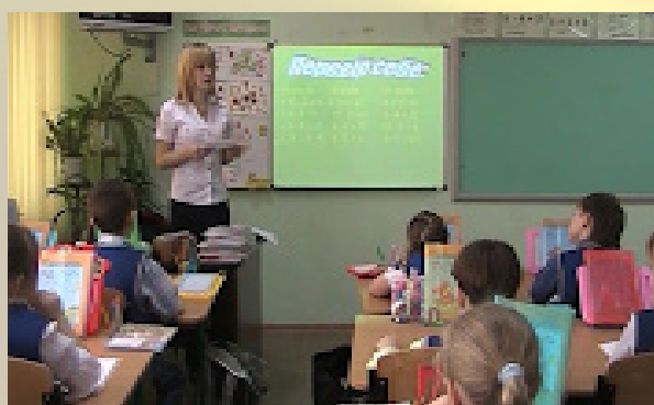
Пробні уроки в школі: