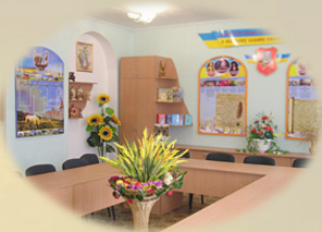
Науково-дослідна лабораторія «Мовна палітра Луганщини»

У системі освітньої і соціально-гуманітарної роботи коледжу функціонують профільні спеціалізовані кабінети, лабораторії та кабінети-музеї, аналогів яким немає в Україні.