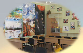
Лабораторія початкової освіти