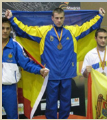
Орлов А. І. – майстер спорту України з кікбоксингу, срібний призер Світу–2011