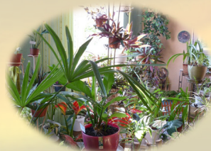
Лабораторія методики ознайомлення з живою природою