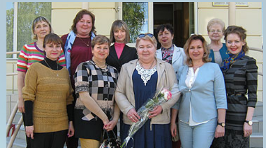
Під час творчої зустрічі з К. Крутії

За підтримки Альма-матер – Луганського національного університету імені Тараса Шевченка – викладачі коледжу ініціюють проведення освітніх форумів та наукових заходів. Активну участь у роботі освітніх локацій беруть провідні науковці університету.