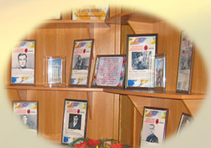
Зала слави і подвигу