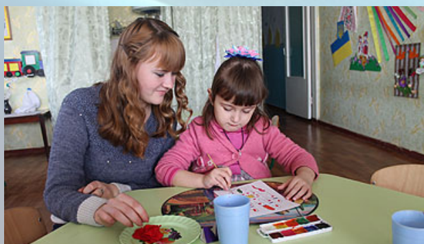
Розвиваєм творчі здібності дошкільників